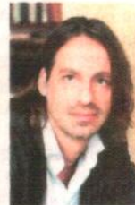
Philosoph Richard David Precht